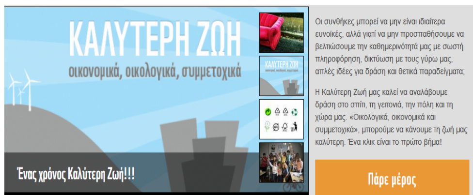
Εικόνα 2: Τμήμα της ιστοσελίδας που λειτουργεί με υπερσύνδεση και παραπέμπει στην αποστολή της εβδομάδας και δίπλα ένα κείμενο για το γενικό σκεπτικό της Καλύτερης Ζωής που καλεί το κοινό να γίνει μέλος αυτής της προσπάθειας

Πιο συγκεκριμένα, μία από τις προσεγγίσεις στο χώρο της Δημόσιας Παιδαγωγικής που κατεύθυναν τον σχεδιασμό της έρευνας είναι αυτή που προσεγγίζει ‘το δημόσιο ως μέρος της μαζικής κουλτούρας και του πολιτισμού της καθημερινότητας’ (Giroux, H. A., 1998). Έτσι, επίκεντρο του ερευνητικού μας προβληματισμού αποτέλεσε το να εξετάσουμε εάν και πώς ανταποκρίνεται η συγκεκριμένη παρέμβαση στο είδος αυτό της δημόσιας παιδαγωγικής, καθώς απευθύνεται στο ευρύ κοινό χρησιμοποιώντας μέσα που προέρχονται από τον πολιτισμό της καθημερινής ζωής, όπως το διαδίκτυο (ιστοσελίδα και μέσα κοινωνικής δικτύωσης), τα οποία γίνονται δίαυλοι μέσω των οποίων οι σχεδιαστές του προγράμματος προσπαθούν να προβάλλουν νέα πρότυπα συμπεριφοράς και να καλλιεργήσουν νέες κοινωνικές ταυτότητες.