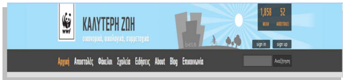
Εικόνα 1: Ζώνη που περιλαμβάνει τον τίτλο και το motto του προγράμματος, τον αριθμό μελών και αποστολών καθώς και τα θέματα και τις υπερσυνδέσεις του προγράμματος.

Η ηλεκτρονική καμπάνια ενημέρωσης και κατάρτισης πολιτών σε θέματα καθημερινότητας και περιβάλλοντος με τον τίτλο «Καλύτερη Ζωή» εγκαινιάστηκε τον Οκτώβριο του 2013 από το WWF - Ελλάς. Πρόθεση των σχεδιαστών της, όπως αποτυπώνεται στο κείμενο της πρότασης για υλοποίηση της παρέμβασης, αποτελεί η ενημέρωση και κινητοποίηση των πολιτών σε θέματα καθημερινότητας μέσα από την προώθηση μικρών αλλαγών στον τρόπο σκέψης και συμπεριφοράς τους.