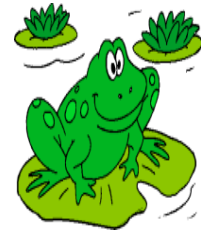
Εικόνα 3: Κούκλα – βάτραχος