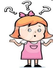
Εικόνα 6: Κούκλα–Αλίκη