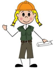
Εικόνα 5: Κούκλα–εργάτης/τρια